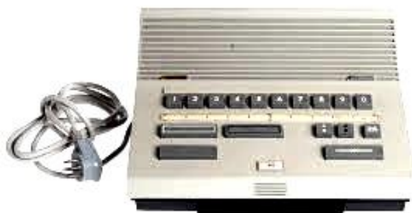
Gyllings befintliga snabbtelefon

Gylling och Co hade en stor produkt, nämligen snabbtelefon. Företaget hade planer på att ta fram en ny version av snabbtelefon.