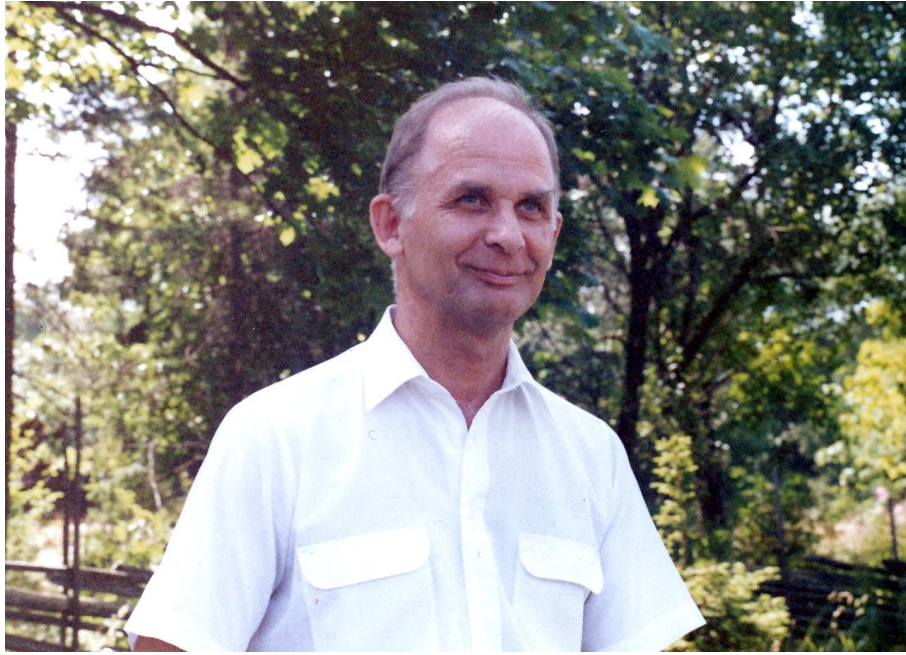
Jag gladdde mig också