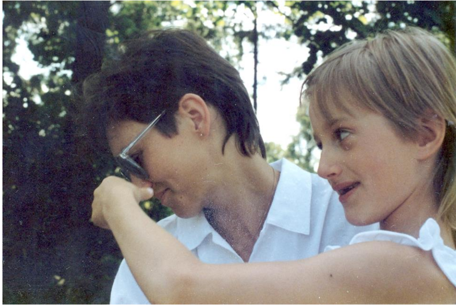
I stället nöp sin mamma i näsan