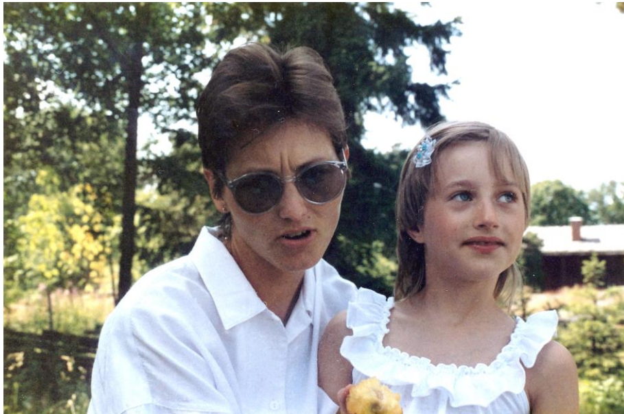
Men Johanna tog det lugnt och satt lite ovilligt i mammans knä