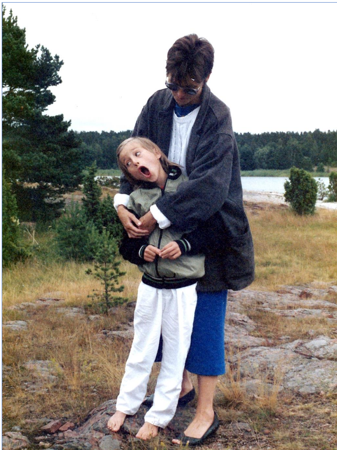
Och kramarna ville hon slippa