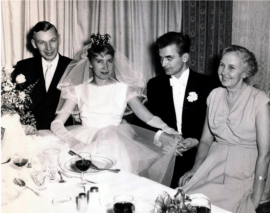
Bruden var i centrum. Svärfar och svärmor verkade nöjda