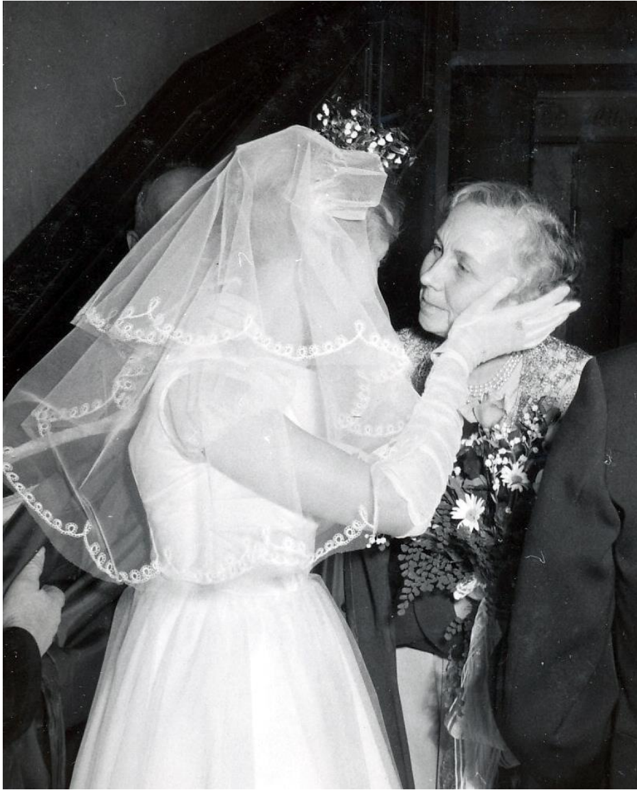
Mamma var glad för oss!