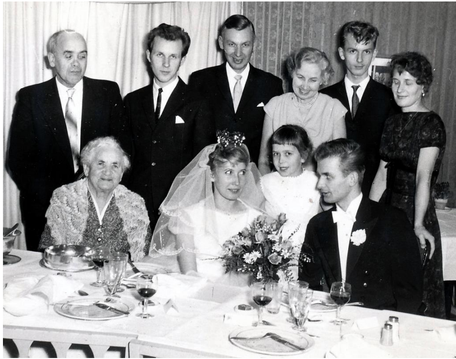
Samlade vid bröllopsmiddagen