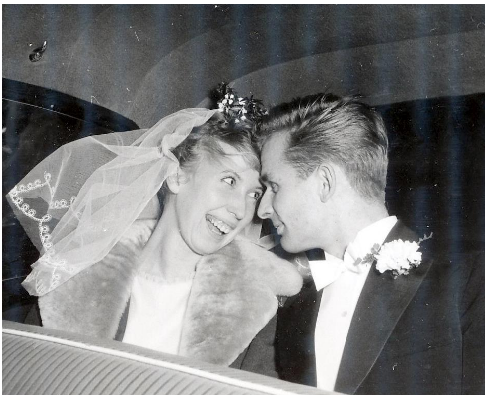
I taxi på väg till Borgen, vårt gamla dansställe