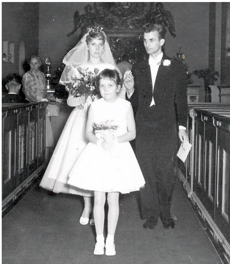
Efter vigseln med vigselbeviset i handen