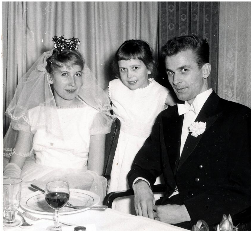
Brudnåben vill också synas