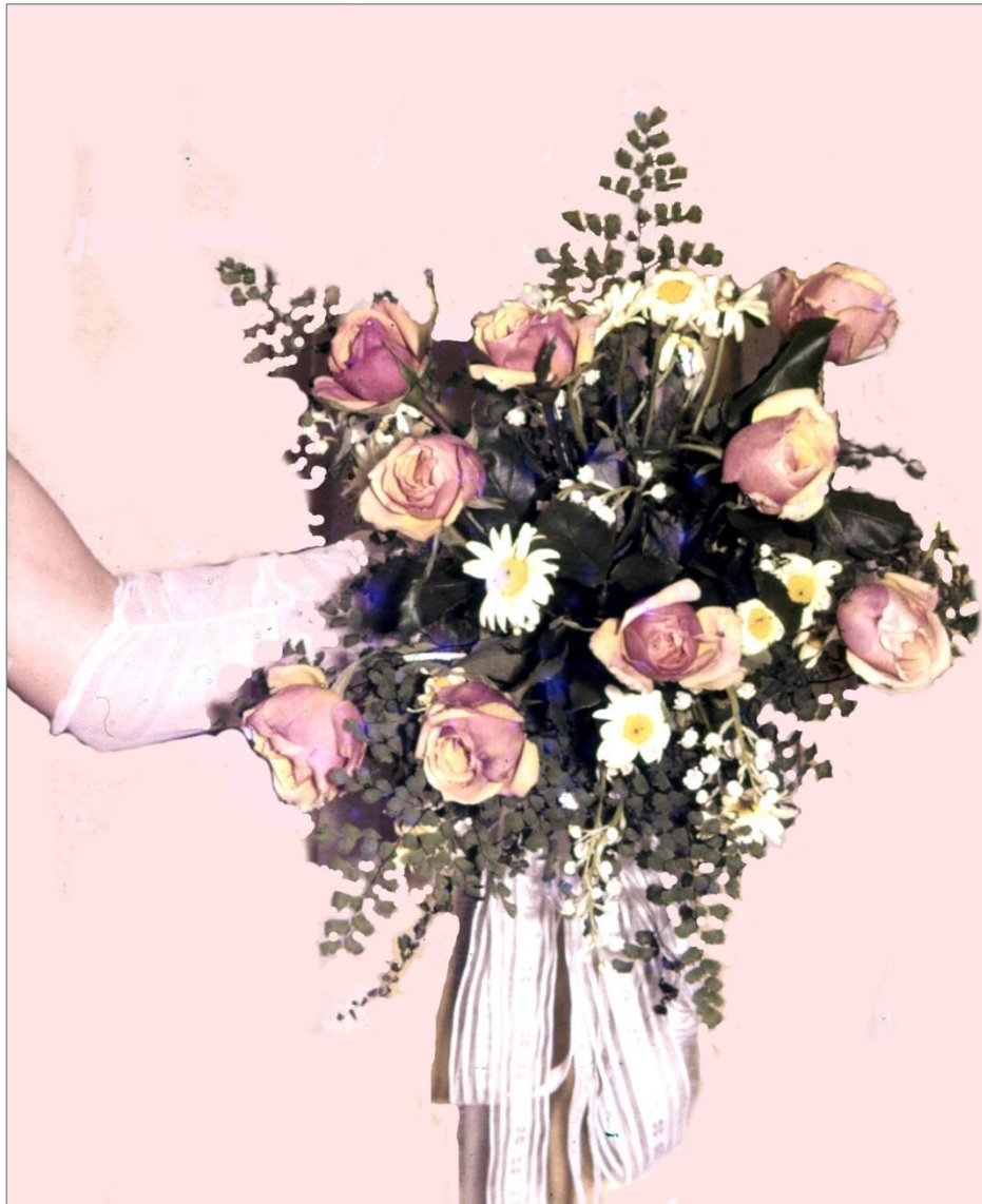
Brudbuketten var klar