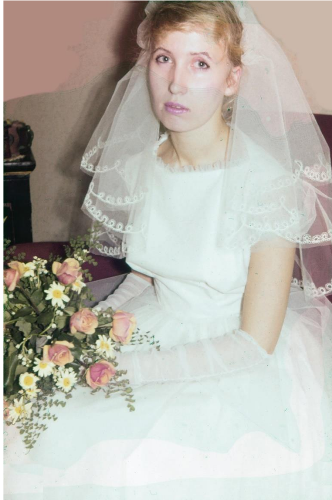
Det var lite nervöst inför vigseln