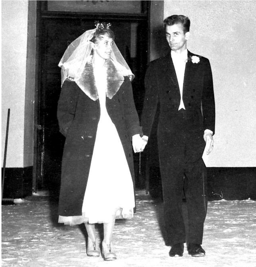
Så var vi ute i kylan