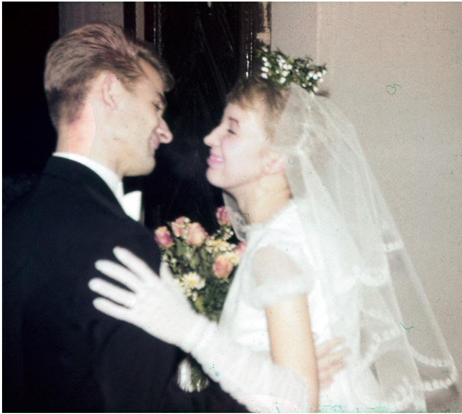
Det blev en dans