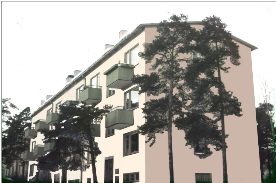
Vår nya bostad på nedre botten