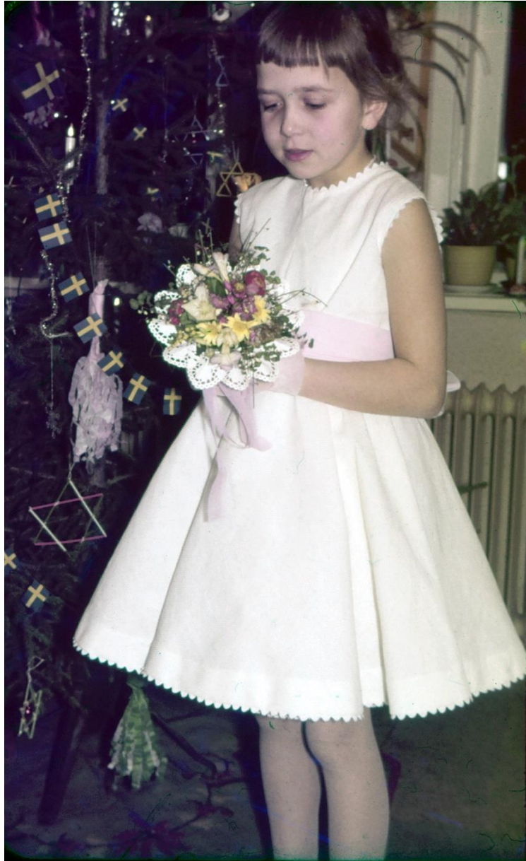
Brudnåbben var beredd