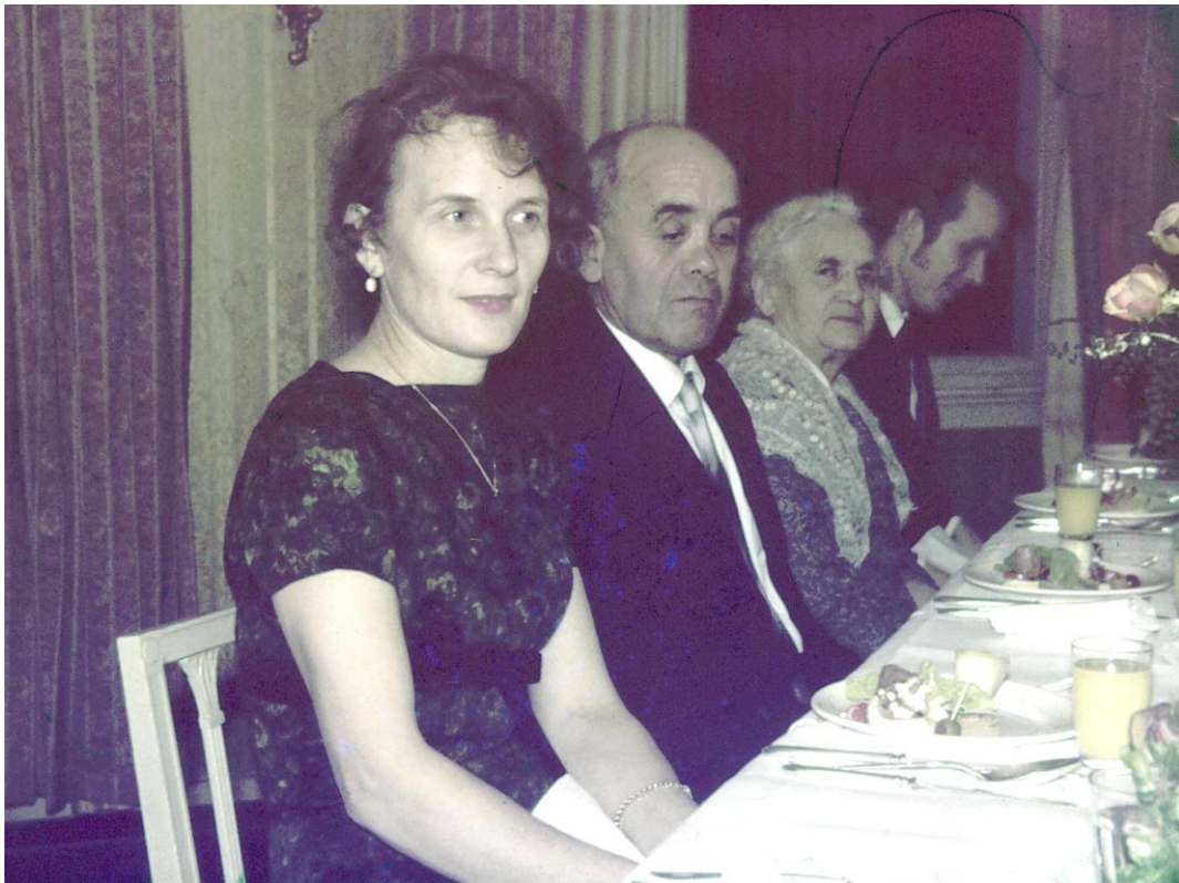
Hur skall det gå för dom?