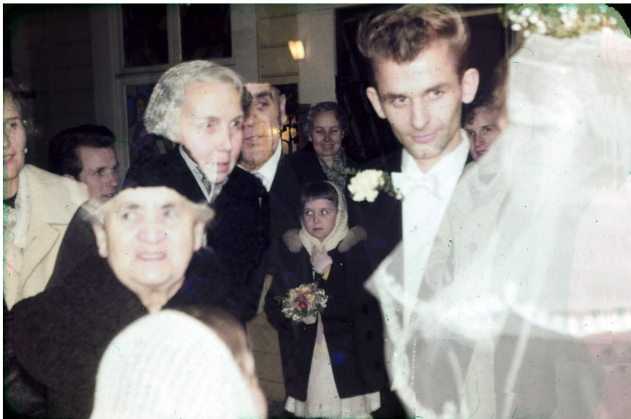
Förvirring inför vigseln