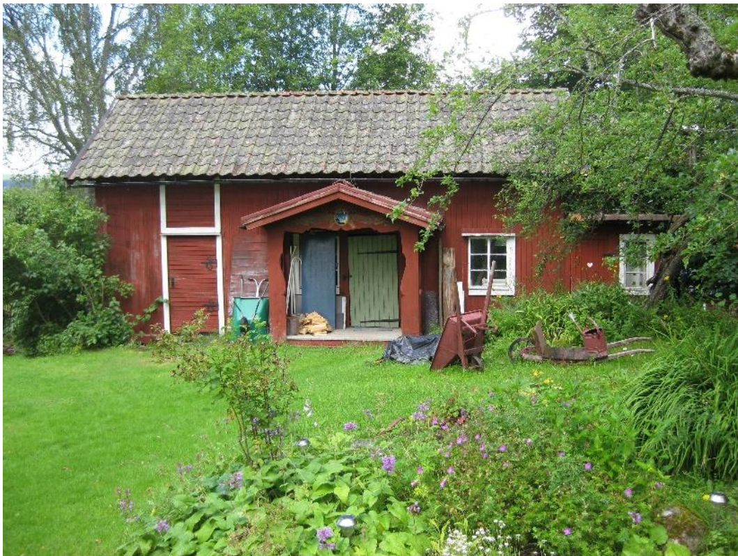
Vår stuga i Kolarbo