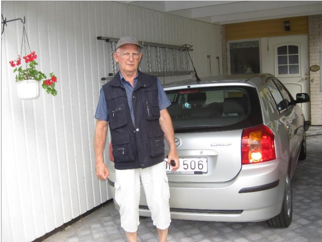
Tänk att allt fick plats i bilen!