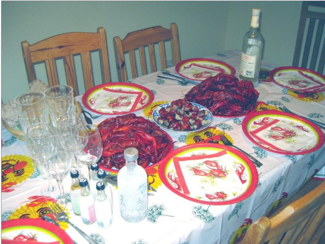
Festen blev storslagen! Hurra för kräftor!

Eftersom Sofia inte mådde bra och Björn fortfarande kände av sin magsjuka blev festen inte lika uppsluppen som på Gotland. Men stämningen var god. Ett överdåd med kräftor och två goda pajer gjorde kvällen mycket nöjsam.