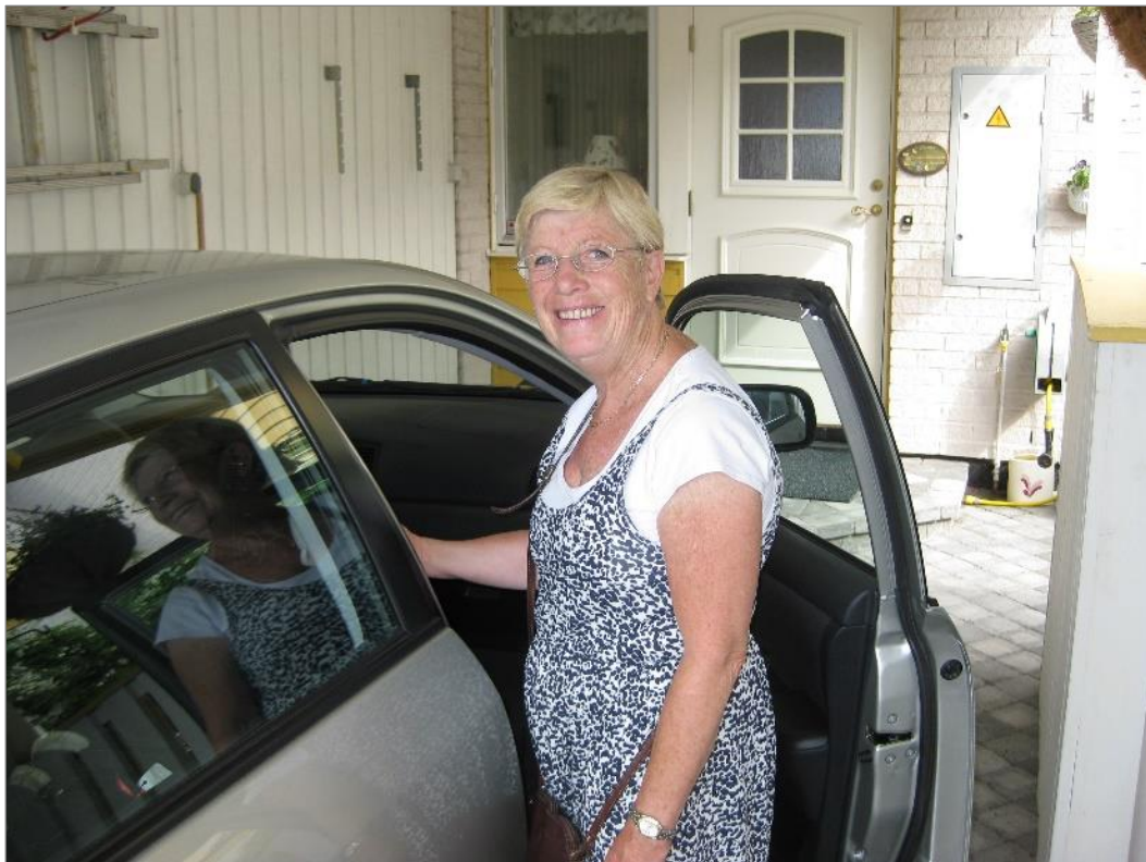
Det visste jag väl hela tiden!