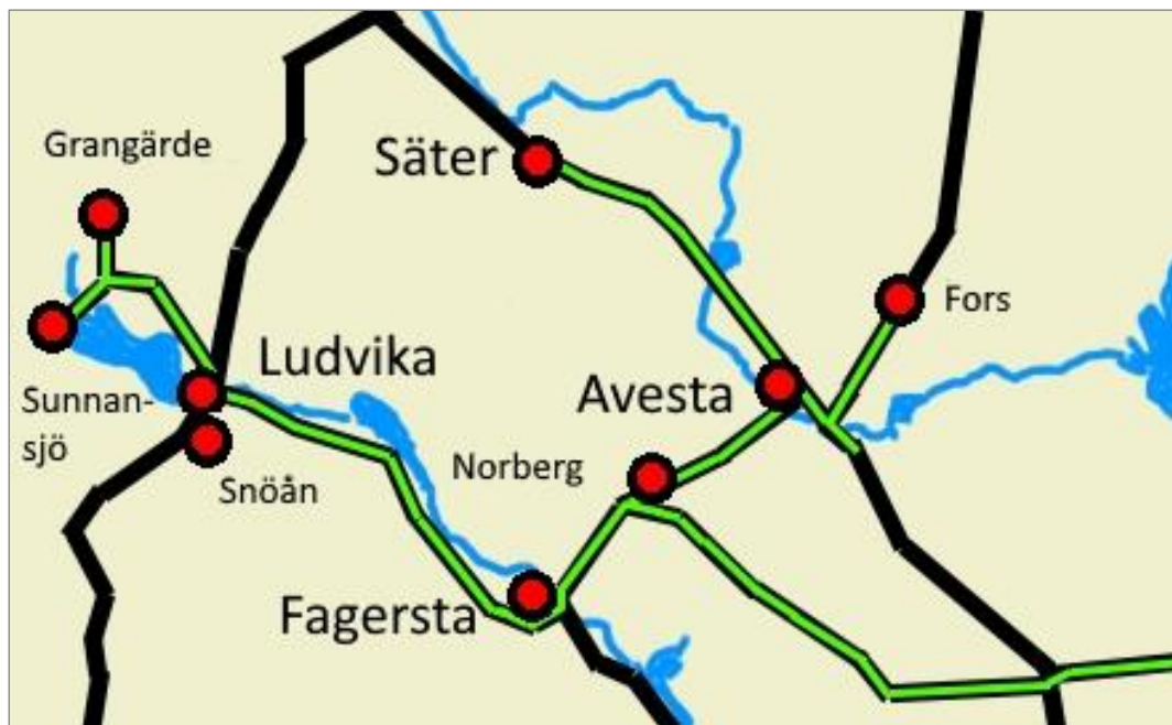
Planerad resväg till Snöån och utflykter