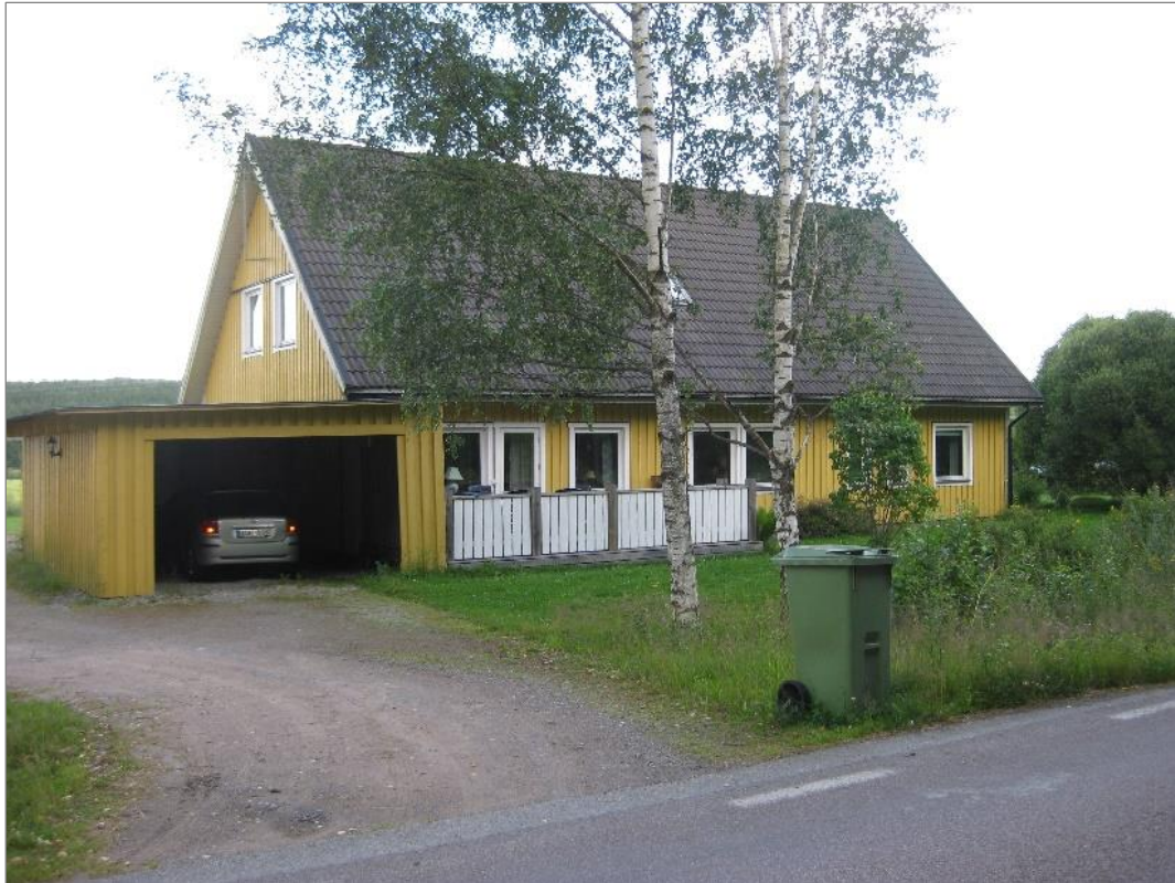
Huset vi hyrde i Snöån

Vi gick runt och tittade. På nedre planet fanns hall kök och matrum, toa och badrum, tre sovrum och ett allrum med utgång till uteplats med grill och sittplatser. På övre planet fanns också tre sovrum, en stor hall med tv, samt badrum.