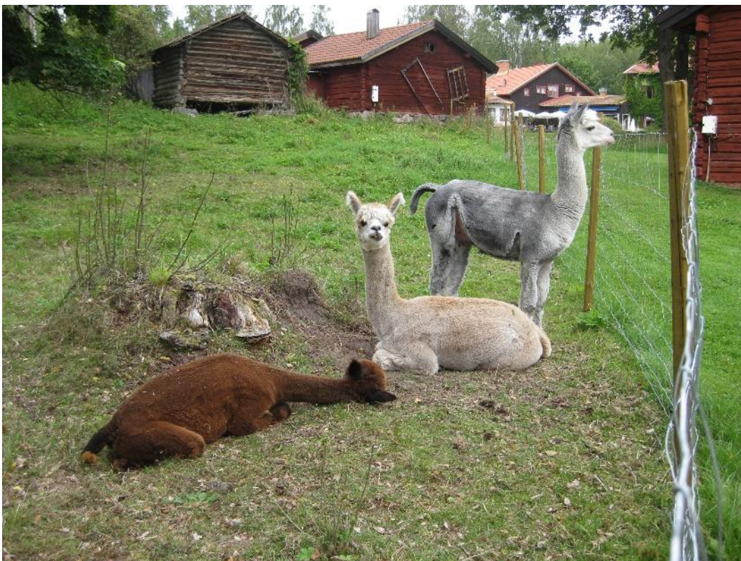
Alpackor var vackra djur