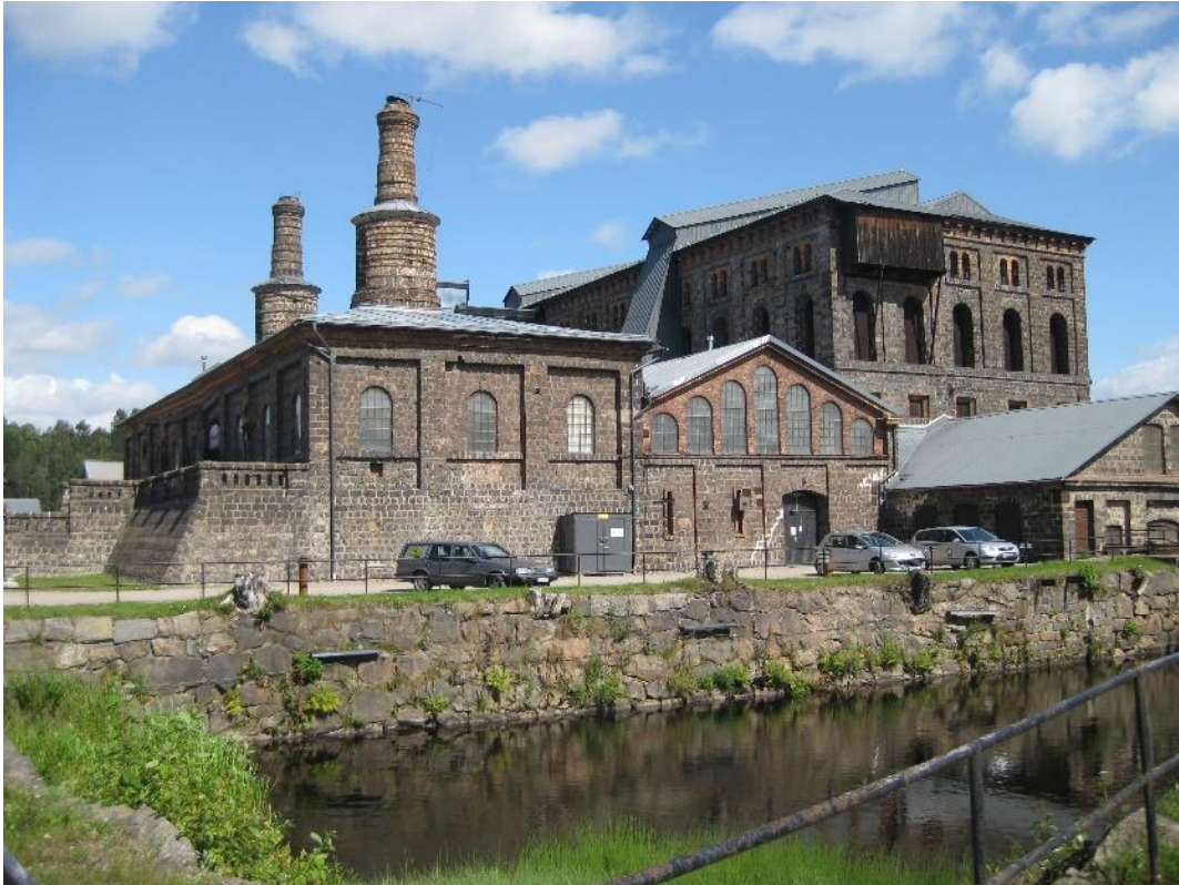
Gamla hyttan i Avesta

Min tid som guide var över och vi återvände till stadens centrum.