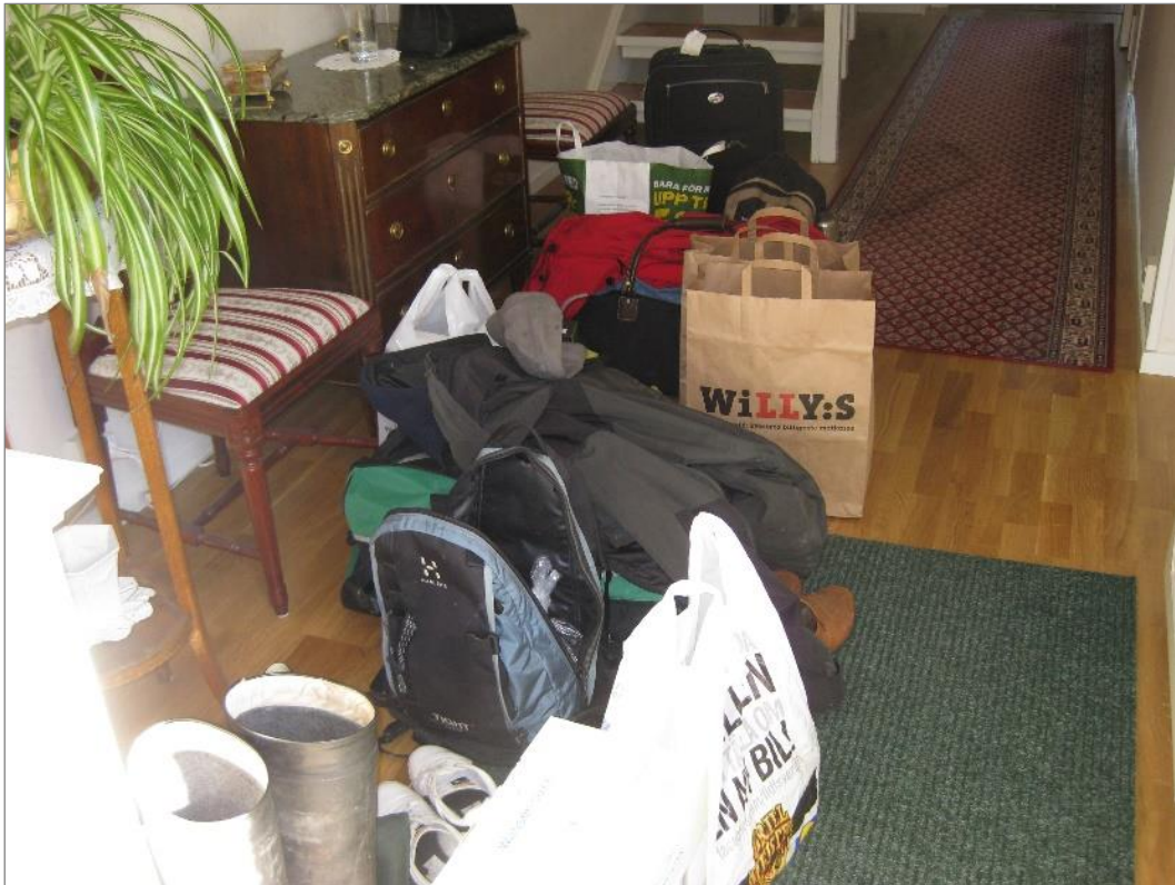
Alla prylar som skulle med fyllde hallen