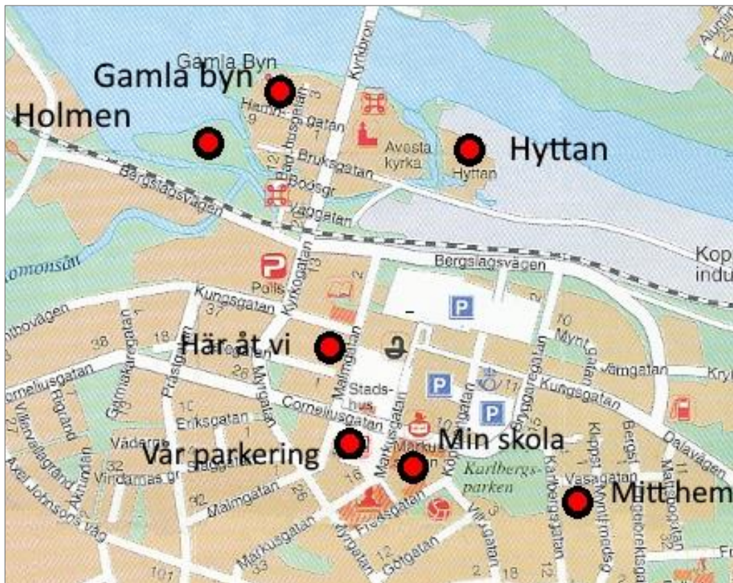
Platserna vi besökte i Avesta

Under måltiden diskuterade vi vad vi skulle välja som dagen utflyktsmål. Efter en intensiv diskussion vald vi att besöka Avesta och Säter.