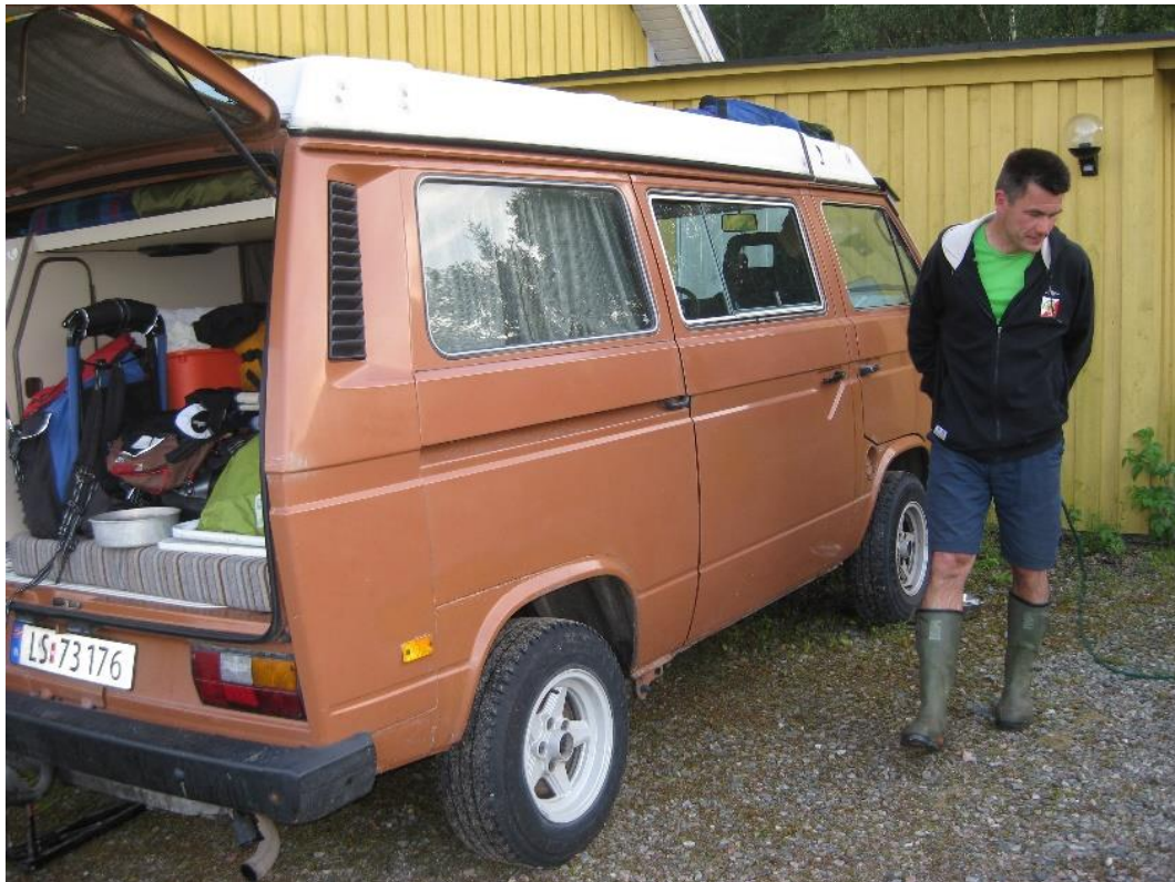
Harald hade mycket som skulle lastas ur bilen

Det var verkligen roligt att ta emot dom. Vi får ju inte så ofta Norge-besök.