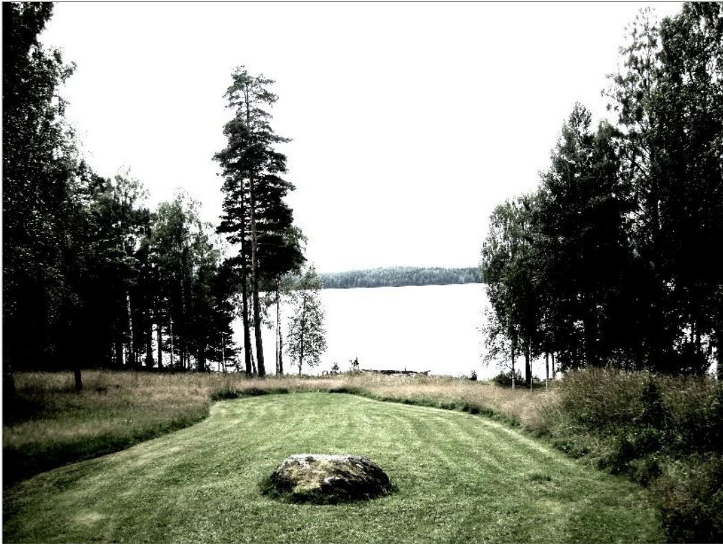
Det var vackert i Sunnansjö