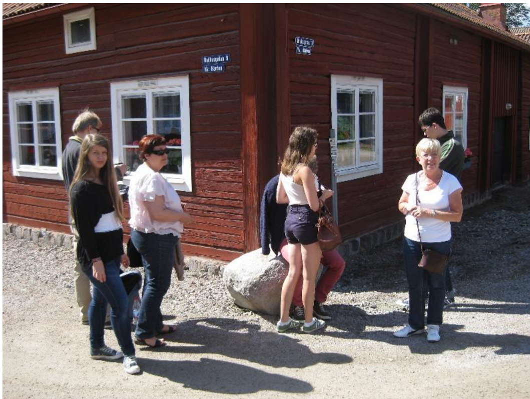
Gamla bruksbyn i Avesta

I Fagersta blev det nödvändigt att stanna för att fylla bensintanken. Framme i Avesta gjorde vi en liten rundtur till Karlbergsgatan invid vattentornet, där jag bott, och folkskolan, där jag gick i under klass 6. Vi parkerade vi mitt emot gamla stadshuset.