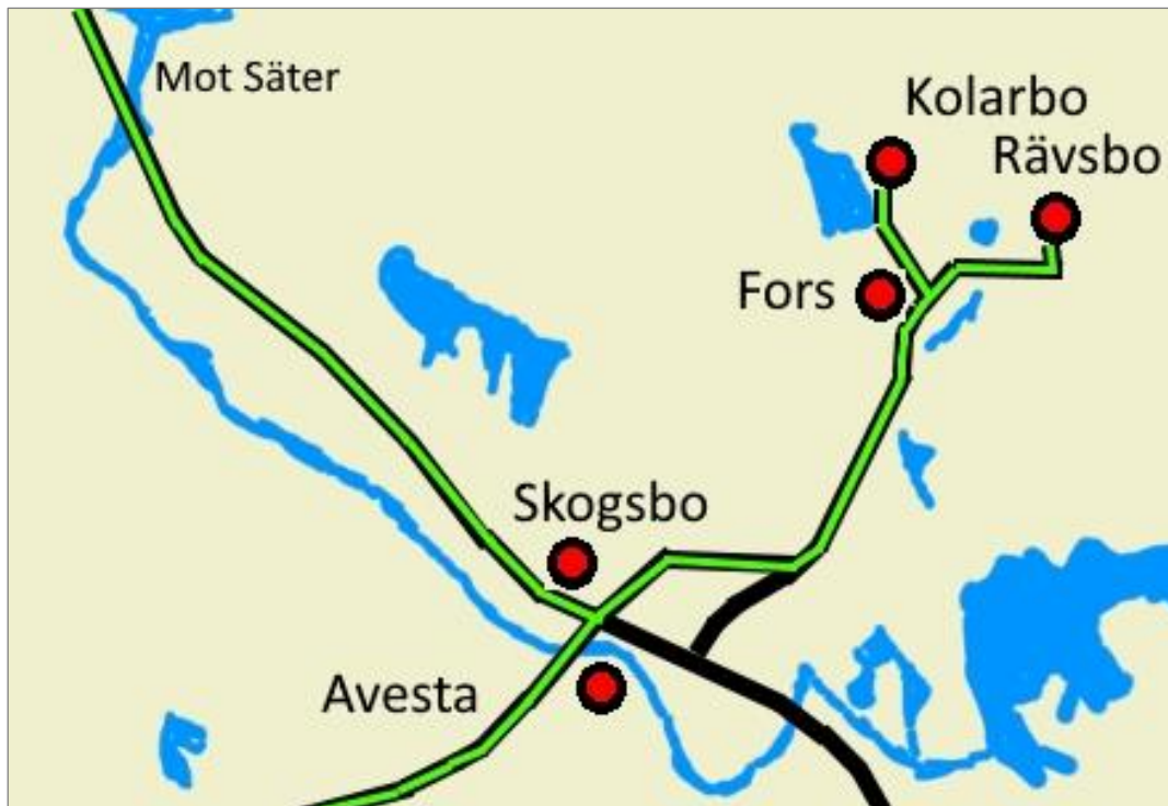
Vår färd till Fors, Kolarbo och Rävsko.