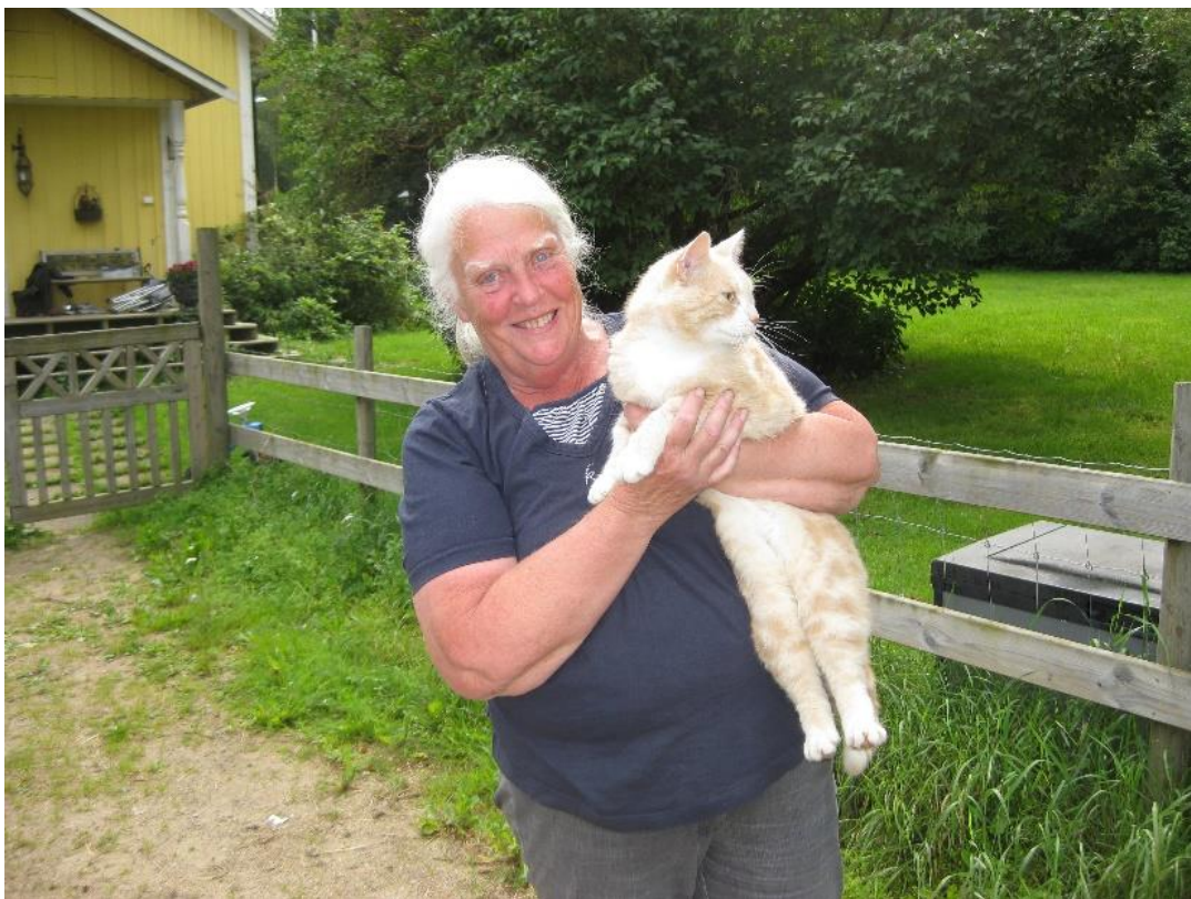
Vår värdinna var stolt över sin katt

Vår värdinna hade sett oss och kom ut till vår bil. Hon hade en liten katt med sig.