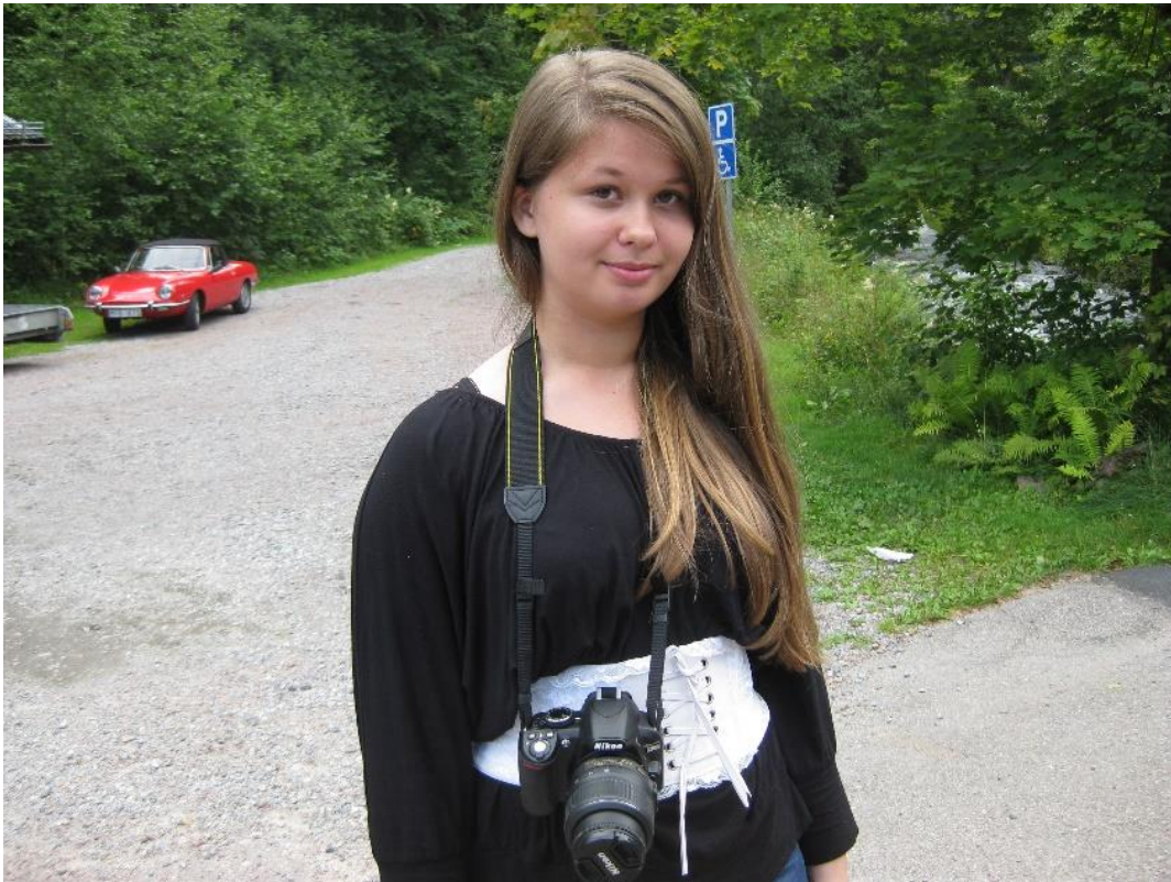
Sofia tänkte fotografera